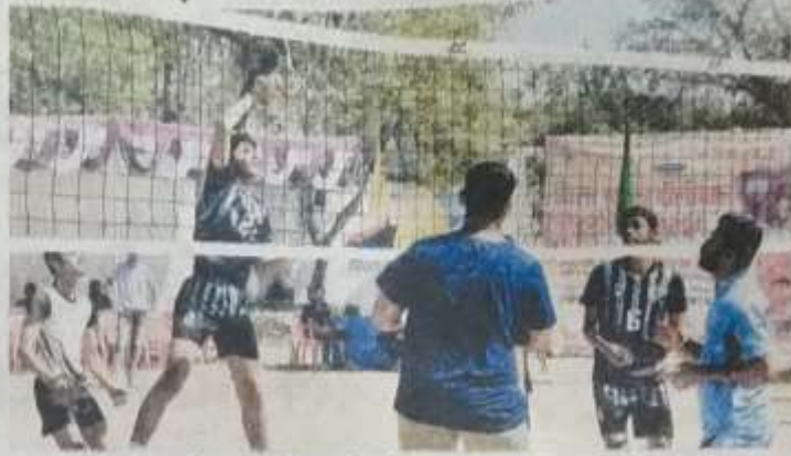
जिला स्तरीय वॉलीबॉल में खेल का प्रदर्शन करते खिलाड़ी।