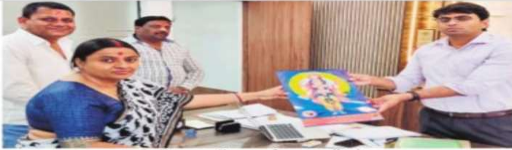
नगर निगम कमिश्नर को ज्ञापन सौंपते हुए।