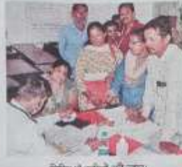
शिविर में प्रवेश की जाह।