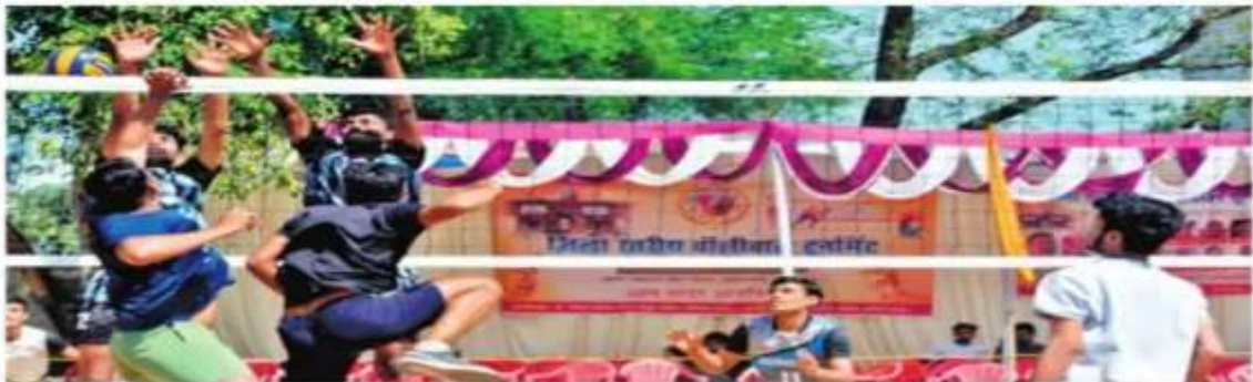
पं. गणेश प्रसाद मिश्र सेवा न्यास द्वारा आयोजित वॉलीबॉल खेलों में शानदार प्रदर्शन करते हुए खिलाड़ी।

इन टीमों ने जीता मैच : पहला मैच खुदहा एवं चूंदा जिसमें खुदहा जीती। दूसरा पुनर्चहां एवं द्विपेटी जिसमें पुनर्चहां जीती। मेहुती एवं किटहा जिसमें मेहुती जीती। चित्रकूट एवं पुनर्चहां में चित्रकूट जीती। चित्रकूट एवं मेहुती में जिसमें मेहुती जीती। पहला सेमी फाइनल वैकटेश एवं चूंदा जिसमें चूंदा जीती। दूसरा सेमी फाइनल खुदहा एवं मेहुती जिसमें मेहुती जीती।