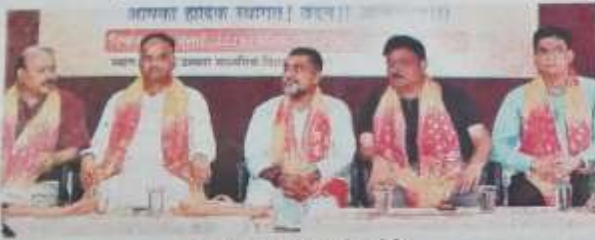
समर्पण अवसर पर संसदीय उपस्थिति।