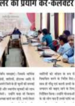
किसान सिंचाई के लिए सिप्रंक्लर का प्रयोग करें-कलेक्टर

कलकत्ता 03 सितंबर (वि.प्र.)। किसान सिंचाई के लिए सिप्रंक्लर का प्रयोग करें-कलेक्टर। बताया गया है कि किसान सिंचाई के लिए सिप्रंक्लर का प्रयोग करें-कलेक्टर। बताया गया है कि किसान सिंचाई के लिए सिप्रंक्लर का प्रयोग करें-कलेक्टर।