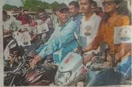
रैली में शामिल मैराथन के कार्यकर्ता