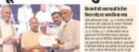
लखनऊ में कल-भाजपा सरकार ने 5 साल में 2,13,400 करोड़ गन्ना मूल्य का किया भुगतान

2,13,400 करोड़ गन्ना मूल्य का किया भुगतान