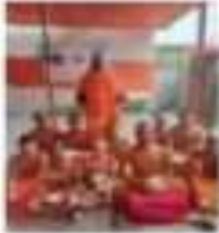
प्रयागराज-बाराह - 4 बाराह की बाराह में बाराह के शुभ अवसर पर 15 बटुकों का यज्ञोपवीत संस्कार हुआ।