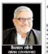
कैलाश तीवरी (अभिनेता)

आपातकाल-25 जून 1975: आपातकाल लगानेवालों की मानसिकता में बदलाव नहीं। आपातकाल-25 जून 1975: आपातकाल लगानेवालों की मानसिकता में बदलाव नहीं। आपातकाल-25 जून 1975: आपातकाल लगानेवालों की मानसिकता में बदलाव नहीं।