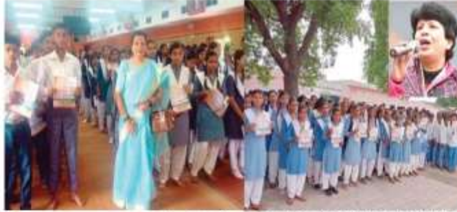
मैराथन 2023 की ब्रांड एंबेसडर डॉ. सुनीता गोदारा (दाएं) और अन्य अधिकारियों के साथ।

सतना हाफ मैराथन 2023 की ब्रांड एंबेसडर डॉ. सुनीता गोदारा हैंगी। एशियाई मैराथन चैंपियन 1992 मैराथन, फिटनेस कोच और प्रमोटर डॉ. सुनीता गोदारा ने 1992 की एशियाई मैराथन चैंपियनशिप जीती। उन्होंने 76 पूर्ण मैराथन (42.2 किमी) पूरी किए हैं। 2010 तक मैराथन दौड़ने वाले कैरियर में 200 से अधिक अंतर्राष्ट्रीय दौड़ का रिकॉर्ड उन्होंने बनाया है। उन्होंने अधिकतम दौड़ों में किंगी भी भारतीय द्वारा