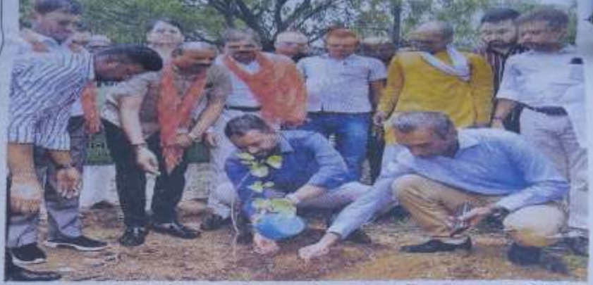
नगर वन में पौध रोपण करते हुए कलेक्टर, महापौर और अन्य अधिकारी