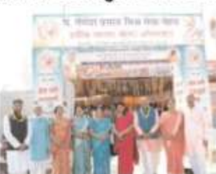
दृष्टि व कान अंश के 835 मरीजों द्वारा स्वस्थता के लिए निःशुल्क चिकित्सा शिविर का आयोजन किया गया।

यह सेवा माघ की ऋतु में माघ मेले के दिनों में कल्पवासियों के स्वास्थ्य परीक्षण के लिए आयोजित की जाती है। इस वर्ष भी माघ मेले के दिनों में कल्पवासियों के स्वास्थ्य परीक्षण के लिए आयोजित किया गया है।