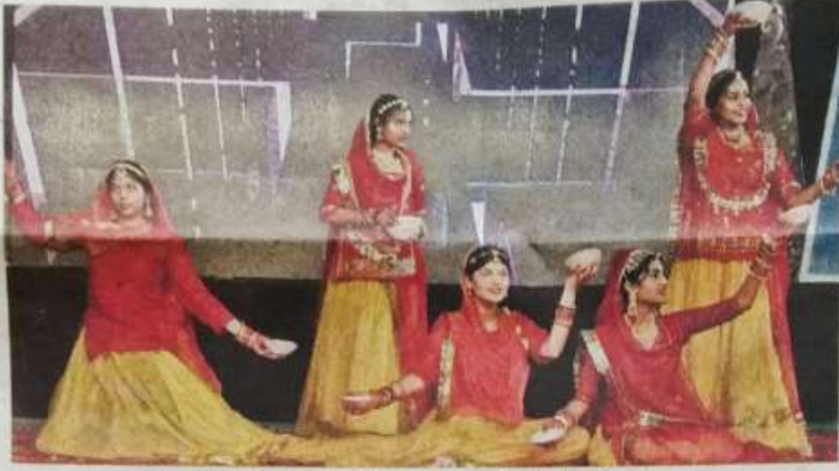
सांस्कृतिक कार्यक्रम में मनमोहक प्रस्तुतियां देती स्टूडेंट्स।