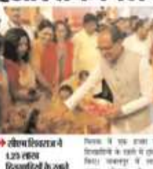
लाडली बहनों को 3 हजार तक मिलेंगे