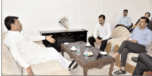
क्षेत्र के सभी क्षेत्रीय एसडीएम को कल्याण योजना का लाभ अभियान

निर्देश दिए कि प्रधानमंत्री किसान सम्मान निधि एवं मुख्यमंत्री किसान