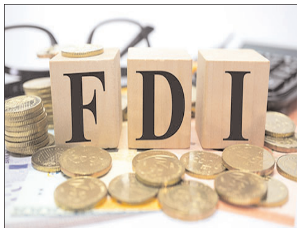
अंतरराष्ट्रीय बाजार में जिसों के दाम, जिस तरह की तेजी दिख रही है, उससे महंगाई खासा बढ़ने का भी खतरा बना

नई दिल्ली। चालू वित्त वर्ष के दौरान देश में प्रत्यक्ष विदेशी निवेश (एफडीआई) 100 अरब डालर यानी करीब 7.5 लाख करोड़ रुपये पर पहुंचने की उम्मीद है। उद्योग संगठन पीएचडी चेंबर आफ कामर्स एंड इंडस्ट्री (पीएचडीसीसीआई) ने गुरुवार को यह उम्मीद जताई। संगठन ने कहा कि हाल के वर्षों में भारत में किए गए आर्थिक सुधारों और कारोबारी सुगमता की दिशा में उठाए गए कदमों के बाद पर भारत चालू वित्त वर्ष में 100 अरब डालर का एफडीआई आकर्षित कर सकता है। उद्योग संगठन ने कहा कि चालू वित्त वर्ष में सकल घरेलू उत्पाद (जीडीपी) वृद्धि दर आठ प्रतिशत से अधिक रहने की संभावना है। हालांकि,