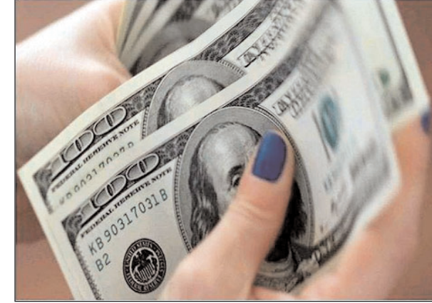
फैब्रिक और अपैरल के उत्पादन के साथ टेक्निकल टेक्सटाइल का उत्पादन करेंगी। इसके तहत उत्तर प्रदेश में आठ कंपनियां निवेश करेंगी, लेकिन बिहार और झारखंड जैसे राज्यों में इस स्क्रीम के तहत कोई निवेश नहीं हो रहा है। पीएलआई स्क्रीम के तहत सबसे अधिक गोवा ग्लास 1,654 करोड़