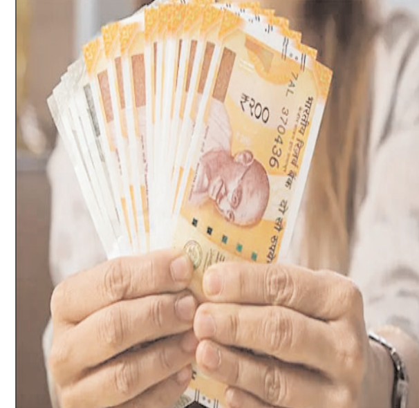
मुताबिक ब्रिगेड एंटरप्राइजेज का टारगेट प्राइस 619 रुपए, प्रेस्टीज

नई दिल्ली। भारत के रियल एस्टेट की कई ऐसी कंपनियां हैं जिनके स्टॉक निवेशकों को अच्छा रिटर्न देने वाले हैं। सेरूलू ब्रोकरेज हाउस एचडीएफसी सिक्वोरिटीज ने ये अनुमान लगाया है। एचडीएफसी सिक्वोरिटीज ने रियल एस्टेट की आठ कंपनियों के स्टॉक्स के लिए टारगेट प्राइस तय किया है। रियल एस्टेट फर्म डीएलएफ के लिए 486 रुपए का टारगेट प्राइस है। वर्तमान में बीएएस इंडेक्स पर स्टॉक का प्राइस 390.85 है। इस हिस्सेब से देखें तो प्रति शेयर निवेशकों को 95 रुपए से ज्यादा का फायदा होगा। वर्तमान में ओबेरॉय रियल्टी का शेयर भाव 998.10 रुपए है, जिसका टारगेट प्राइस 1,142 रुपए था। फीनिक्स मिल्स का टारगेट प्राइस 1,364 रुपए तय किया गया है। वर्तमान में इसकी कीमत 1065.15 रुपए है। एचडीएफसी सिक्वोरिटीज के